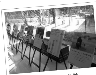
三井住友銀行 SMBCパーク 栄

まずは「市民とつながるポスターコンテスト」。ぼらチャリ参加16団体が学生ボランティアと制作したポスターが市内9か所とウェブ上で掲示されたことで、より多くの市民に各団体の活動を知ってもらえかけとなりました。