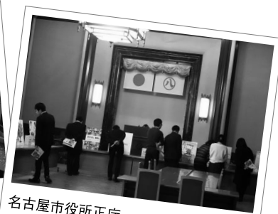
名古屋市役所正庁